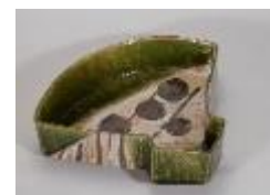
織部 扇面鉢(個人蔵)