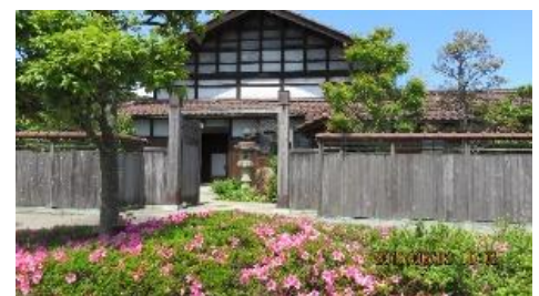
蘇梁館(そりょうかん)

○各日程の参加費/1,200円(拝観料、ガイド料) 定員15人位 ○イベントコース/蘇梁館集合 9:15 蘇梁館出発 9:30(徒歩)→各寺院訪問 → 蘇梁館(12時頃解散) 当日お弁当持参歓迎、蘇梁館又は公園のベンチで食事ができます。